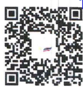
วิทยาลัยชุมชนอุทัยธานี

Handwritten signature (แทน) ผอ.สอ. 15/9/2564