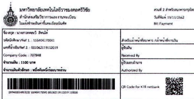
รูปแสดงใบชำระเงินค่าขึ้นทะเบียนบัณฑิต