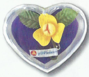
เข็มกลัดดอกลำดวน ในกล่องรูปหัวใจ ราคา ๕๐ บาท