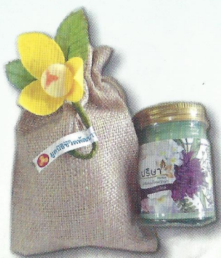
ถุงดอกลำดวน (บาล์มสมุนไพรทุกยา) ราคา ๑๐๐ บาท