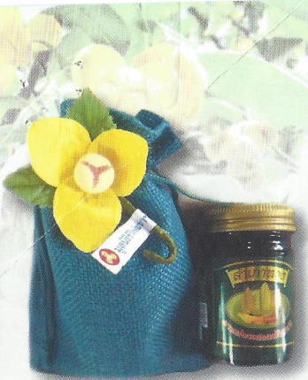
ยาหม่องดอกลำดวน ราคา ๖๐ บาท