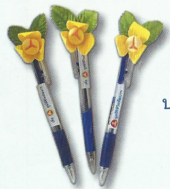
ปากกาดอกลำดวน ราคา ๓๐ บาท