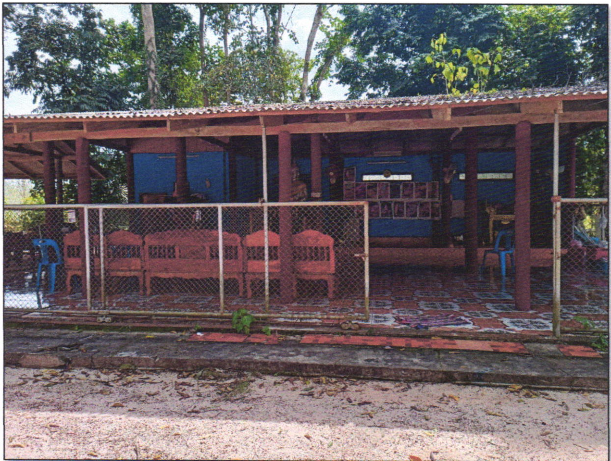
ภาพถ่ายสำนักสงฆ์คลองกวางพัฒนา หมู่ที่ ๖ ตำบลคลองกวาง อำเภอนาทวี จังหวัดสงขลา