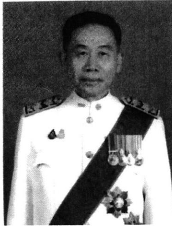
ศาสตราจารย์อุดม รัฐอมฤต

หากท่านผู้ใดมีข้อมูล ข้อเท็จจริง และข้อคิดเห็นเกี่ยวกับบุคคลผู้ได้รับการเสนอชื่อ ให้ดำรงตำแหน่งตุลาการศาลรัฐธรรมนูญ