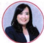
พศ.ดร.นัฐริกา آهن