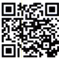
QR code ลงทะเบียน

จึงเรียนมาเพื่อโปรดพิจารณาส่งบุคลากรเข้ารับการอบรมและขอความอนุเคราะห์ประชาสัมพันธ์ให้บุคลากรในหน่วยงานของท่านทราบต่อไปด้วย จะขอบคุณยิ่ง