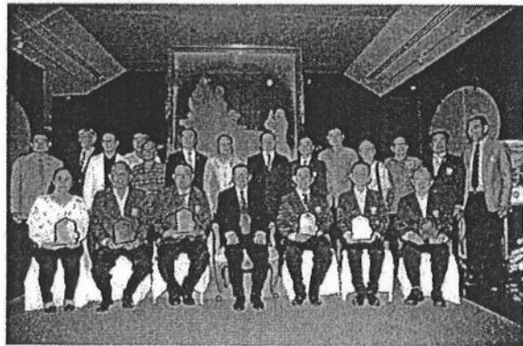
ภาพแสดงรางวัลการยกย่องเชิดชูเกียรติ “คนดีศรีสงขลา ๒๕๖๐” จากมูลนิธิเรารักสงขลาเฉลิมพระเกียรติ