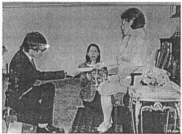
ภาพโล่รางวัล และการรับรางวัลจากสมเด็จพระเทพรัตนราชสุดาฯ สยามบรมราชกุมารี เมื่อวันที่ ๑๑ มิถุนายน ๒๕๕๖