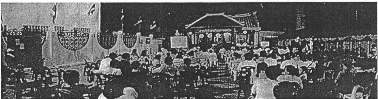
ภาพการประชุมเสวนาเมื่อวันที่ ๑๕ พฤศจิกายน ๒๕๕๒ ระหว่างเทศบาลนครสงขลา การเคหะแห่งชาติ และภาคีคนรักเมืองสงขลา

๖. ร่วมมือกับองค์กรทั้งภาคประชาชน เอกชน และภาครัฐที่มีเจตคติที่ดีต่อเมือง สงขลา เพื่อบูรณาการทรัพยากรที่มีอยู่ทั้งหมดสร้างสงขลาให้เป็นเมืองที่น่าอยู่สำหรับทุกคน