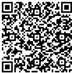
ดาวน์โหลดสิ่งที่ส่งมาด้วย

จึงเรียนมาเพื่อโปรดพิจารณา และขอขอบพระคุณในความร่วมมือมา ณ โอกาสนี้