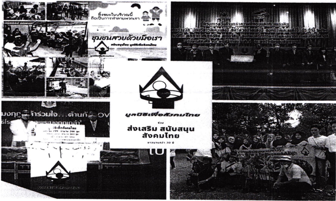
กิจกรรมเพื่อสังคมและประเทศชาติ(บางส่วน) โดยมูลนิธิเพื่อสังคมไทยและสมาชิกเครือข่ายรางวัลไทย