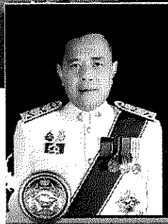
ภาพตอนตึก จิตติสัมพันธ์ ผู้ว่าราชการจังหวัดสงขลา