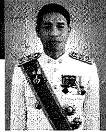
ภาพต่อหน้า พลตรีศุภเดช รองผู้ว่าราชการจังหวัด