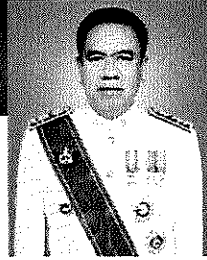
ภาพต่อหน้า นายสุทิน รองผู้ว่าราชการจังหวัด