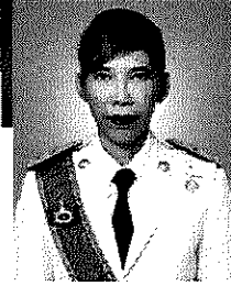
ภาพต่อหน้า นาย รองผู้ว่าราชการจังหวัด