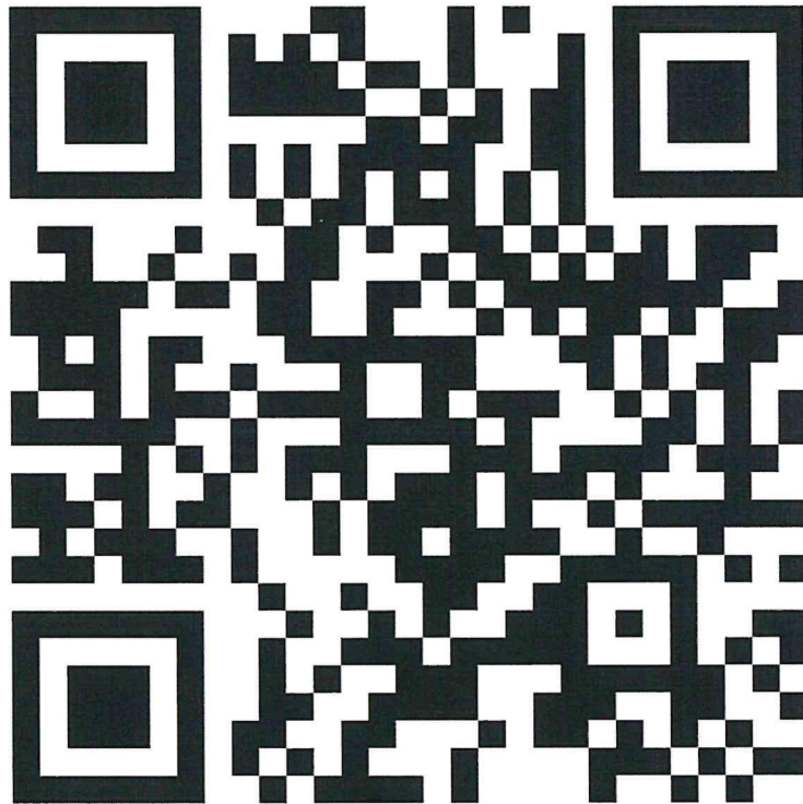
QR CODE ประกาศ จำนวน 3 ฉบับ

๓. ประกาศ เรื่อง การให้ข้อกำหนด ประกาศ และคำสั่งที่นายกรัฐมนตรีกำหนดตามประกาศสถานการณ์ฉุกเฉินยังคงมีผลใช้บังคับ ลงวันที่ ๒๕ พฤษภาคม ๒๕๖๕