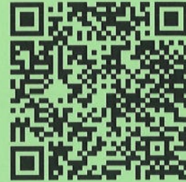
QR CODE ใบสมัครอบรม จป.หัวหน้างาน

2. ท่านสามารถดาวน์โหลดใบสมัครได้ที่ QR CODE และส่งใบสมัครมาที่ e-mail : wse_center@pim.ac.th