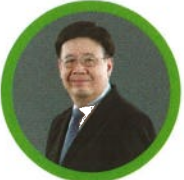
รศ.ดร.สมภพ มานะรังสรรค์ อธิการบดีสถาบันการจัดการปัญญาภิวัฒน์