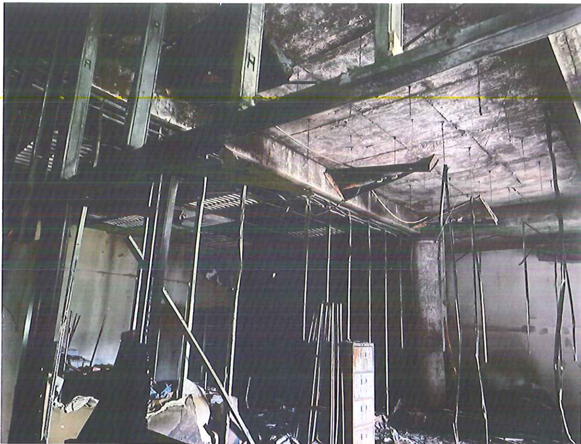
ภาพห้องต้นเพลิงและห้องที่ได้รับความเสียหาย