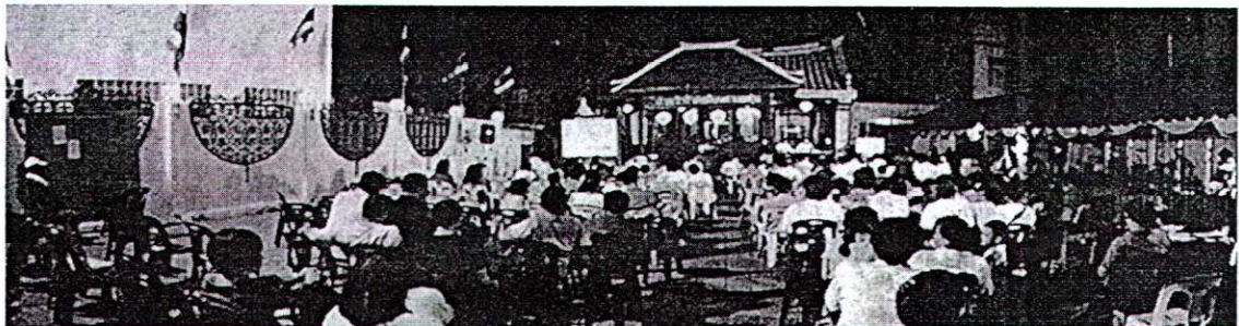
ภาพการประชุมเสวนาเมื่อวันที่ ๑๕ พฤศจิกายน ๒๕๕๒ ระหว่างเทศบาลนครสงขลา การเคหะแห่งชาติ และภาคีคนรักเมืองสงขลา

๖. ร่วมมือกับองค์กรทั้งภาคประชาชน เอกชน และภาครัฐที่มีเจตคติที่ดีต่อเมือง สงขลา เพื่อบูรณาการทรัพยากรที่มีอยู่ทั้งหมดสร้างสงขลาให้เป็นเมืองที่น่าอยู่สำหรับทุกคน