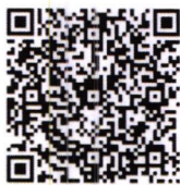
QR code ลงทะเบียน

จึงเรียนมาเพื่อโปรดพิจารณาส่งบุคลากรเข้ารับการอบรมและขอความอนุเคราะห์ประชาสัมพันธ์ให้บุคลากร ในหน่วยงานของท่านทราบต่อไปด้วย จะขอบคุณยิ่ง