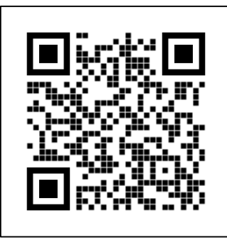
QR CODE สำหรับแสดงความคิดเห็น

เรียน คณบดี -เห็นควรมอบคัสเสนอ (นายวิชา สิริคุณ)