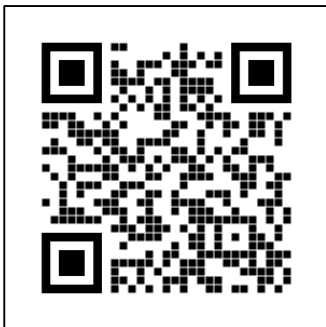
QR CODE สำหรับแสดงความคิดเห็น