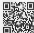
QR-Code เพื่อจองห้องพัก

โทรศัพท์: ๐๒-๔๒๒-๙๒๒๒ E-mail : rsvn@royalriverhotel.com