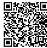
๓. แบบตอบรับการเข้าร่วมสัมมนา