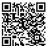
๑. กำหนดการสัมมนา