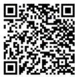
๒. แผนที่จัดสัมมนา