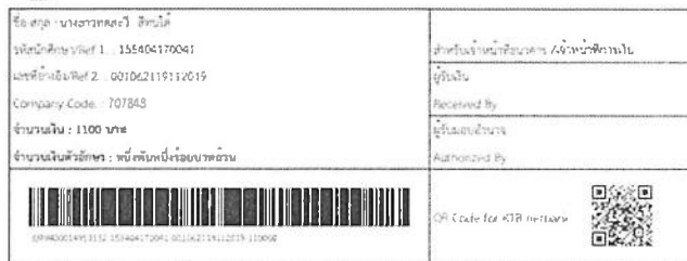
รูปแสดงใบชำระเงินค่าขึ้นทะเบียนบัณฑิต

วันที่ 2 สิงหาคม 2562 รับเงินที่ 19/11/2562 Bill Payment