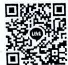
QR Code Line

เขตป้อมปราบศัตรูพ่าย กรุงเทพฯ ๑๐๑๐๐ โทร.๐๒-๒๒๓-๐๓๑๖ โทรสาร ๐๒-๒๒๑-๘๐๐๑ E-mail : bhumibalofd@gmail.com www.bhumibalo.org