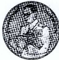
ด้านหน้า