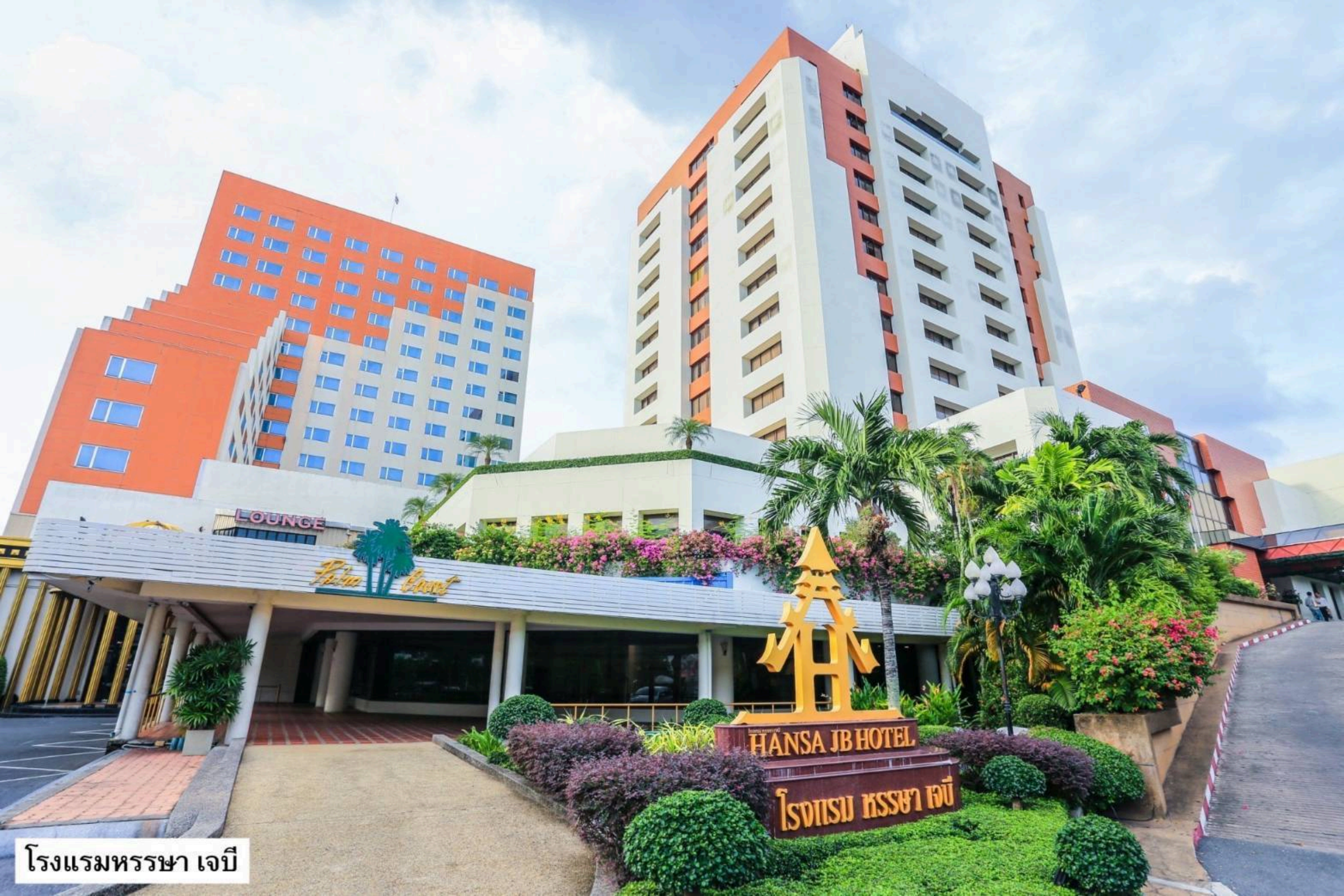
โรงแรมทรรษา เจบี