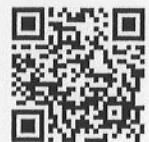
QR-Code เพื่อจองห้องพัก

โทรศัพท์: ๐๒-๔๒๒-๙๒๒๒ E-mail : rsvn@royalriverhotel.com