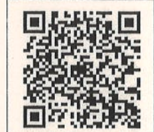
QR-Code เพื่อสอบถาม