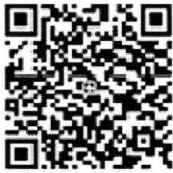
ร่วมทำบุญผ่านระบบ e - Donation