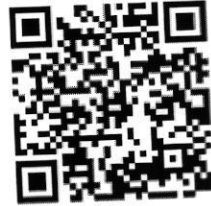
QR code สำหรับลงทะเบียน

ผู้ที่มีความประสงค์ร่วมนำเสนอผลงานวิจัยสามารถลงทะเบียนสมัครได้ที่ https://research.kpru.ac.th/std-conference/ หรือทาง QR code ที่อยู่ด้านล่างนี้ โดยชำระค่าลงทะเบียนหลังการส่งบทความเข้าระบบ เพื่อเป็นการยืนยันการส่งบทความให้พิจารณาเข้าร่วมการประชุมวิชาการ