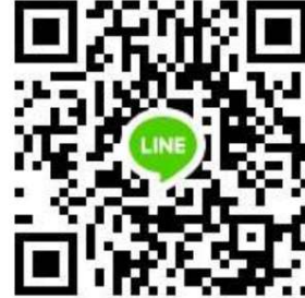
กลุ่มไลน์