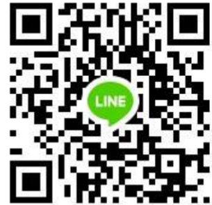
กลุ่มไลน์