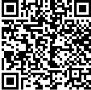
สมัครออนไลน์