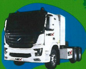
EV Tractor (423 hwh) TM-0309