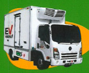
EV 6W Jumbo TM-0304