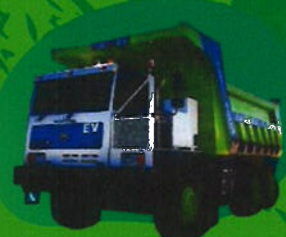
EV Mining Truck TM-0310