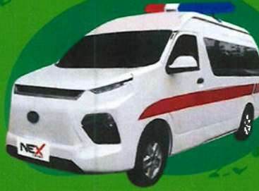
EV Ambulance Van TM-0102