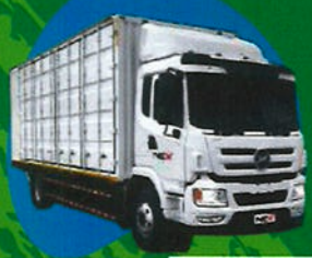
EV Cargo Truck 6W 15 Tons TM-0306