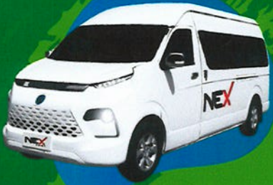
EV Passenger Van TM-0101