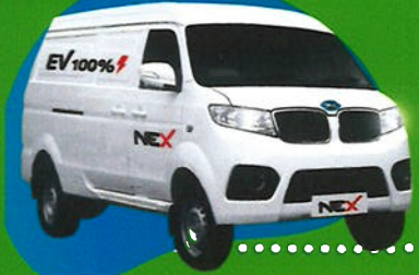
EV Cargo Van TM-0103