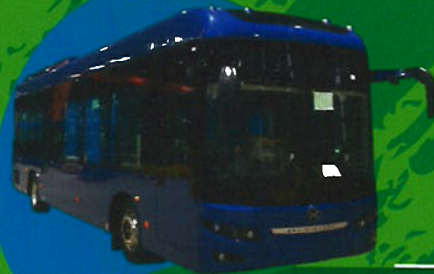
EV City Bus 11 m TM-0205