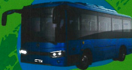
EV Minibus 7.3 m TM-0201