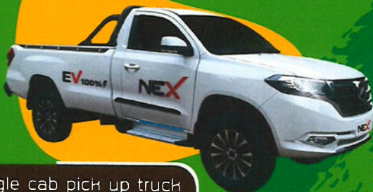
EV Single cab pick up truck TM-0301