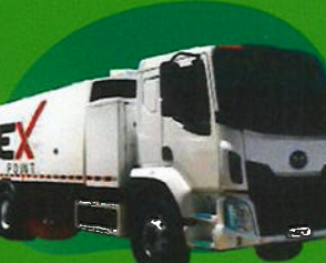
EV Sweeper Truck TM-0313