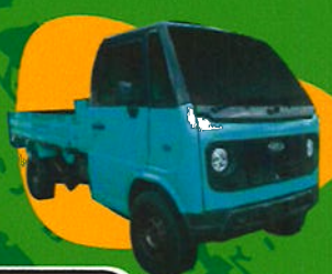
Mine MT30 TM-0303