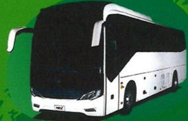
EV Coach TM-0203