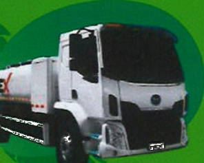
EV Spraying Water Truck TM-0312