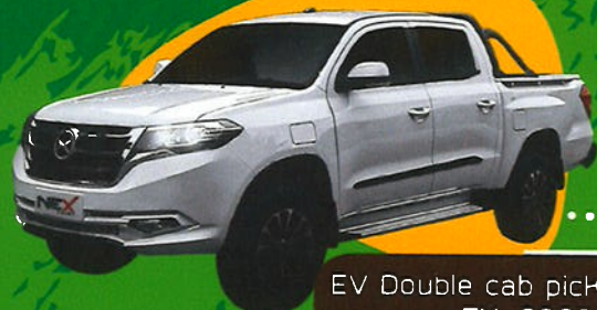
EV Double cab pick up truck TM-0302