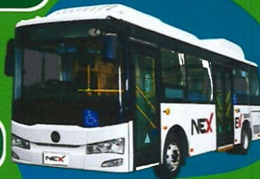
EV City Bus 8 m TM-0204