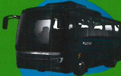
EV Minibus 7.6 m TM-0202