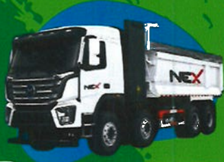
EV Dumber 12W TM-0307