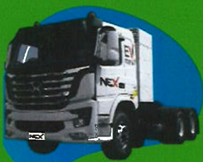
EV Tractor (282 hwh) TM-0308