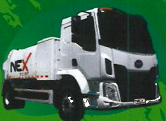
EV Garbage Truck TM-0311