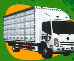
EV Cargo Truck 6W 10 Tons TM-0305