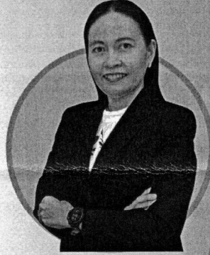
อ.มยุรี ชวนชม